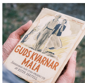
Guds kvarnar mala är skriven av Ester Härtull.

–Jag tänkte att det kommer ta för mycket tid. Men nu när vi är igång ångrar jag absolut inte att jag valde att vara med. Det är så