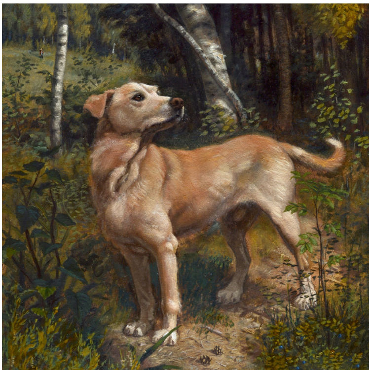
En bild på en hund som David Still målat

Han inledde sina studier på en privat konstskola i Stockholm. Efteråt blev han antagen till en konstskola