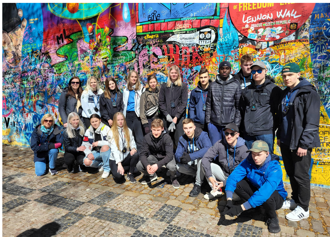
Nästan hela gänget vid "Lennon wall", också kallad "Wall of freedom".

ONSDAG FÖRMIDDAG fick vi bekanta oss med staden ordentligt då guidad cykeltur stod på programmet. Rutten gick via de största sevärdheterna och vår guide lärde oss mera om det vi fick se och om stadens historia. Mina favoriter från den kalla och blåsiga – men roliga – cykelturen var