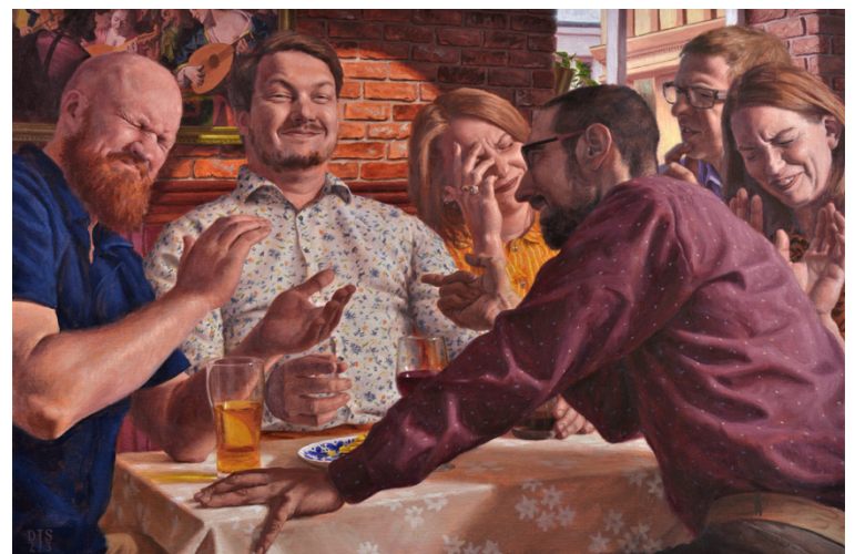
Tavlan Ordvisten ingår i utställningen "Mellanrum"

Djupsjöbacka) fick en tjänst som småbarnspedagog i Vörå flyttade de dit. Han har sin ateljé hemma i Andkil.